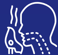
Kubura umwuka/Kunanirwa guhumeka