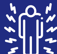
Kuryaryata k'umubiri, gusesa urumeza